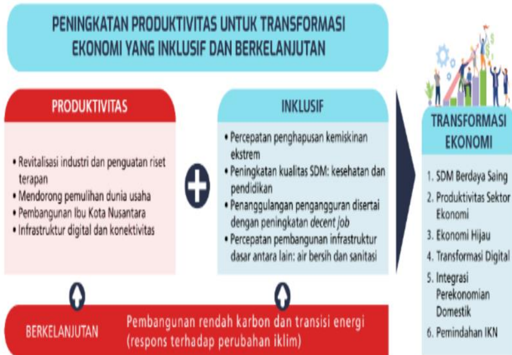
Gambar III.3. Kerangka Pikir Rencana Kerja Pemerintah (RKP) 2023