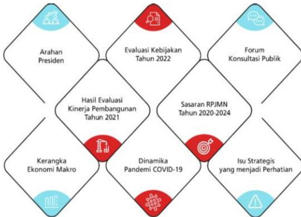
Gambar III.1. Penyusunan Tema Pembangunan RKP Tahun 2023