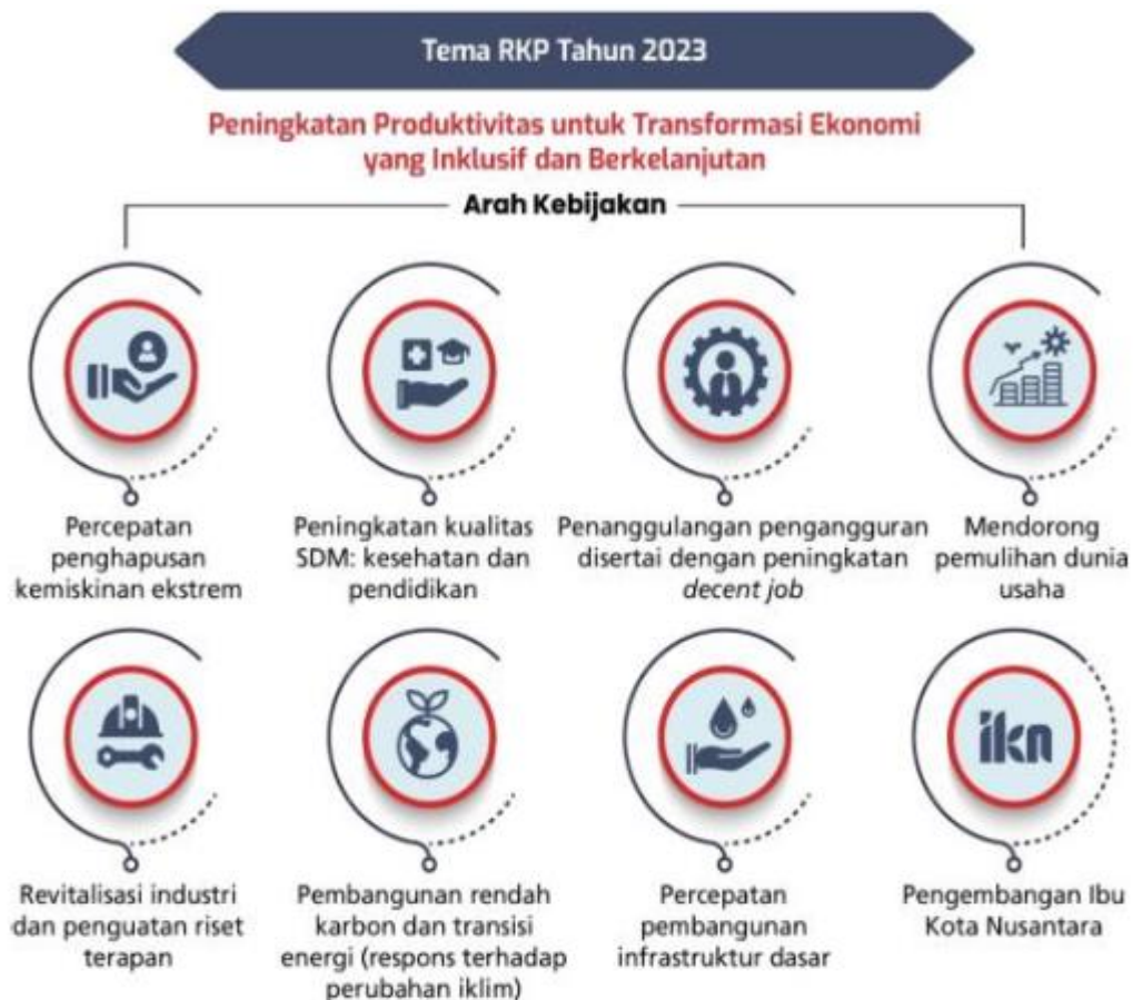
Gambar III.5 Strategi Pembangunan Nasional Tahun 2023

Arah kebijakan dan strategi pembangunan nasional tahun 2023 selanjutnya dituangkan ke dalam tujuh Prioritas Nasional (PN) RKP Tahun 2023. Tujuh PN merupakan Agenda Pembangunan yang termuat dalam