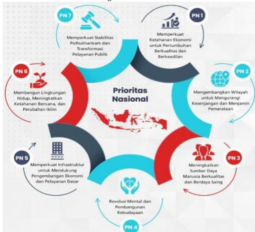
Gambar III.6 Prioritas Pembangunan Nasional Tahun